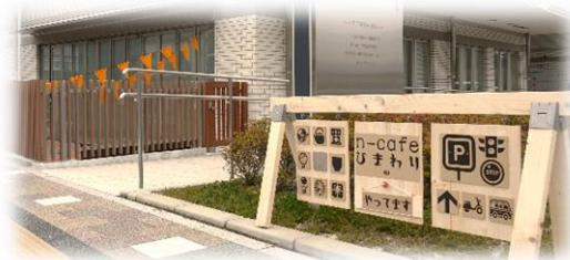
【JR廿日市駅北口オレンジの旗を目印に】